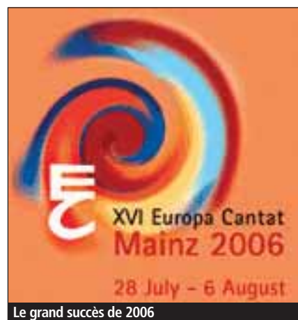
Le grand succès de 2006

En revanche, pour moi, le festival représente la réalisation des idéaux pour lesquels je travaille (promouvoir la tolérance en Europe, améliorer la qualité